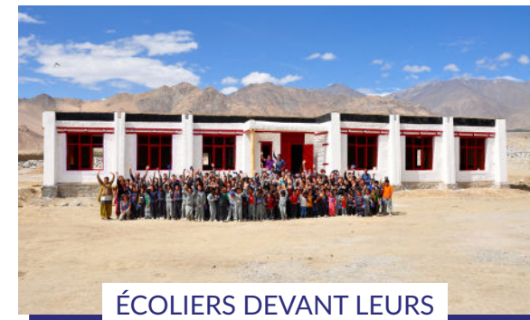
ÉCOLIERS DEVANT LEURS NOUVELLES CLASSES