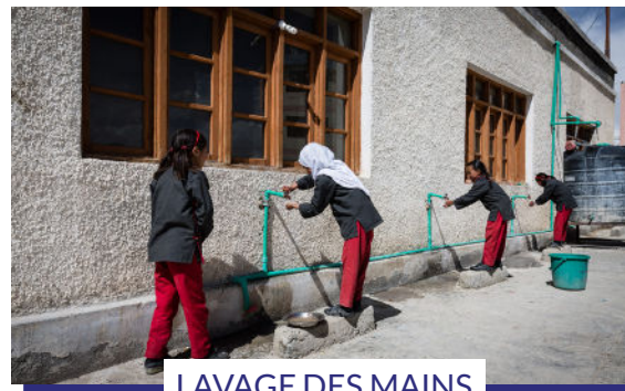
LAVAGE DES MAINS