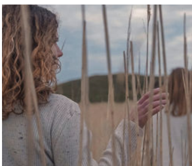
© Extrait - La Mélodie du silence